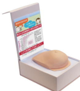
場所を取らず・選ばず展示