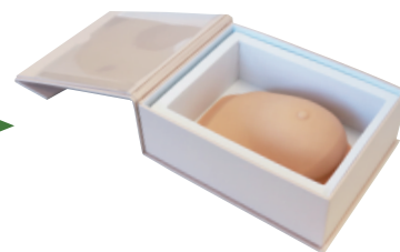
使用後はそのまま収納