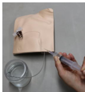
シリンジを使い、フラッシュと逆流確認を行うことができます。

鎖骨下静脈および内頸静脈経路で留置した CV ポートに穿刺トレーニングするためのモデルです。表皮、および脂肪がバイオスキンで作られているため、非常にリアルなトレーニングが可能です。