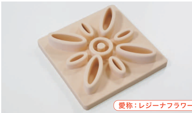
愛称：レジーナフラー