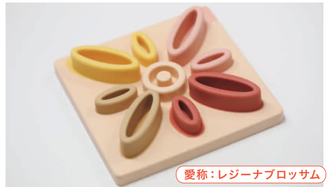
愛称：レジーナブロッサム